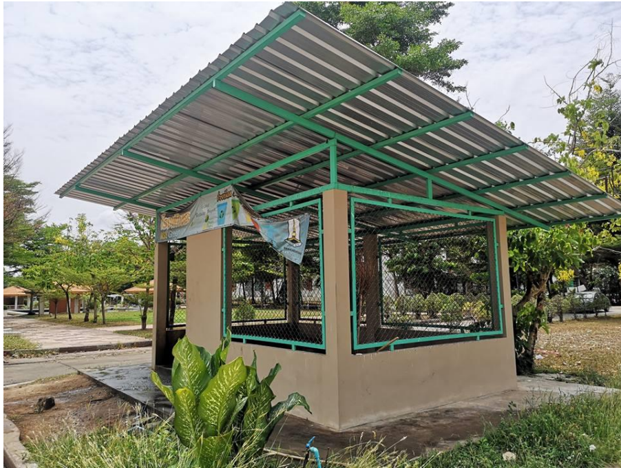
จุดพักขยะ ของมหาวิทยาลัยมหาสารคาม

❖ พนักงานทำความสะอาด สำนักวิทยบริการ นำขยะที่คัดแยกแล้ว ประกอบด้วย ขยะเปียก ขยะทั่วไป และ ขยะอันตราย ไปยังพื้นที่พักขยะที่มหาวิทยาลัยจัดไว้ เพื่อทางมหาวิทยาลัยจะได้ดำเนินการกำจัดขยะอย่าง ถูกต้องตามหลักวิชาการต่อไป